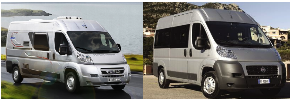
Två identiskt lika stora bilar utvändigt. Bil 1 till vänster och bil 2 till höger. Texten i detta dokument kommer flera gånger referera till denna bild.

Idag anser vi att husbilar är väldigt diskriminerade prismässigt. Naturligtvis ska en stor bil betala mer än en liten. Men så är inte fallet idag. Det är vad bilen har för inredning som bestämmer priset idag. Måttet 1,70 finns i Ålandstrafikens prislista för släp så antar det är måttet som gäller för hyllorna på skärgårdsfärjorna. Men en utredning vilket mått som ska användas borde göras. Alfågeln: Frihöjd under bilhyllan är 2,2 meter. Men vad är frihöjden på hyllan, och vad har andra båtar. Nå i detta dokument är det oviktigt utan vi använder måttet 1,70.